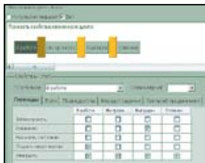
Рис. 3. Критерии переходов на этапах жизненного цикла

На каждом этапе жизненного цикла были определены права контроля доступа, а также задан крите-