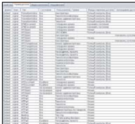
Рис. 1. Фрагмент набора правил управления доступом

Особо нужно отметить то, что при широкомасштабном внедрении Windchill вопросы формирования непротиворечивых политик требуют очень тщательной и детальной проработки.